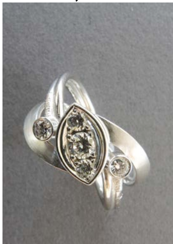
Ring Wg Fr. 2800.-