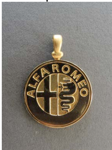
Anhänger Gg 750 Fr. 1250.-