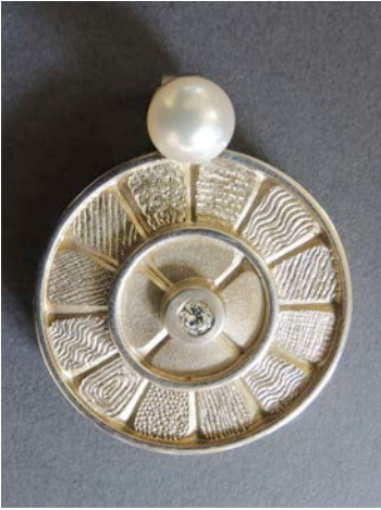
Silber / Brillant Fr. 1300.-