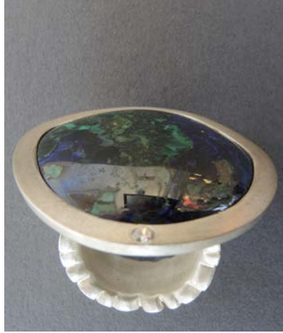
Silber / Brillant Azurit Fr. 950.-