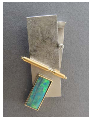
Opalanhänger Fr. 1500.-