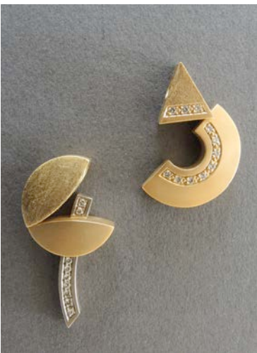
Glücksbringer je Fr. 950.-