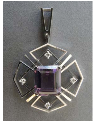
Amethyst Wg Fr. 1000.-