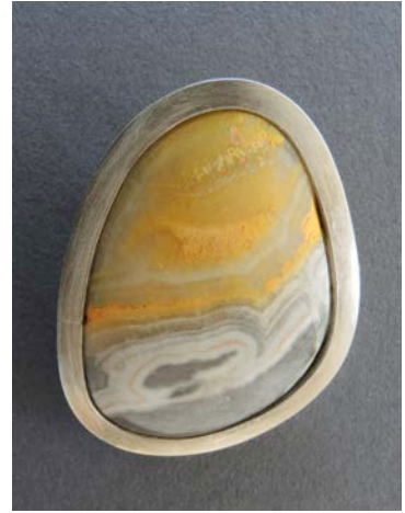
Silber / Jaspis Fr. 590.-